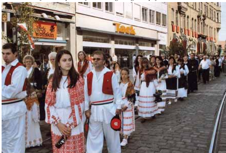
Tjelovska prozacija kroz Augsburg 15. lipnja 2006

nego većina njegovih prijašnjih kritičara. Želim da Papinu poruku iz njegove prve enciklike «Deus carita est - Bog je ljubav» primimo sa zahvalnošću u našim obiteljima, u školama, na radnim mjestima, u javnom zajedničkom i političkom životu, i da kršćansku poruku kao alternativni program za nas same i za zajednički život u našem društvu čvršće nosimo. Za sebe i za našu biskupiju želim da doista izgrađujemo jedinstvo u vjeri, jedinstvo koje je ponajprije utemeljeno na još većem i rastućem poštivanju Euharistije. Za mene je veoma važno, da se mi više usredotočimo na kršćanske korjene i sadržaje naše vjere, i na prijateljstvo s Isusom Kristom, a manje raspravljamo o strukturama i upravnim jedinicama A.P.