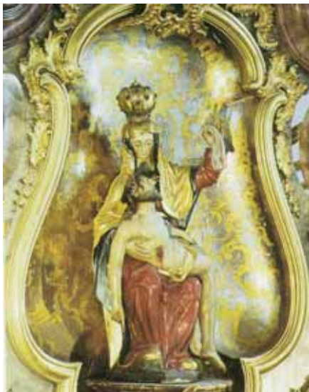
Glavni oltar u Vesperbildu

prošteništa u Maria Vesperbildu iz 17. stoljeća, točnije 1650. godine kad je sagrađena mala poljska kapelica na putu od Ziemetshausena i Langenneufnach, kao zahvala za kraj tridesetgodišnjega rata, Jakova od sv. Vincenta. 1673. počinje gradnja veće kapelice, da bi 1725. godine počeli s izgradnjom prošteništa crkve čija je posveta bila 1756. godine te je postala središte pobožnosti. Čudotvorna slika je u središtu oltara iz 16. stoljeća, ona prikazuje Mariju kako svog mrtvog sina drži u rukama. Spuštena Isusova ruka pokazuje na svetohranište koje je zapravo središnja točka svake crkve. U lijevoj ruci Marija drži rupčić s kojim želi reći:.