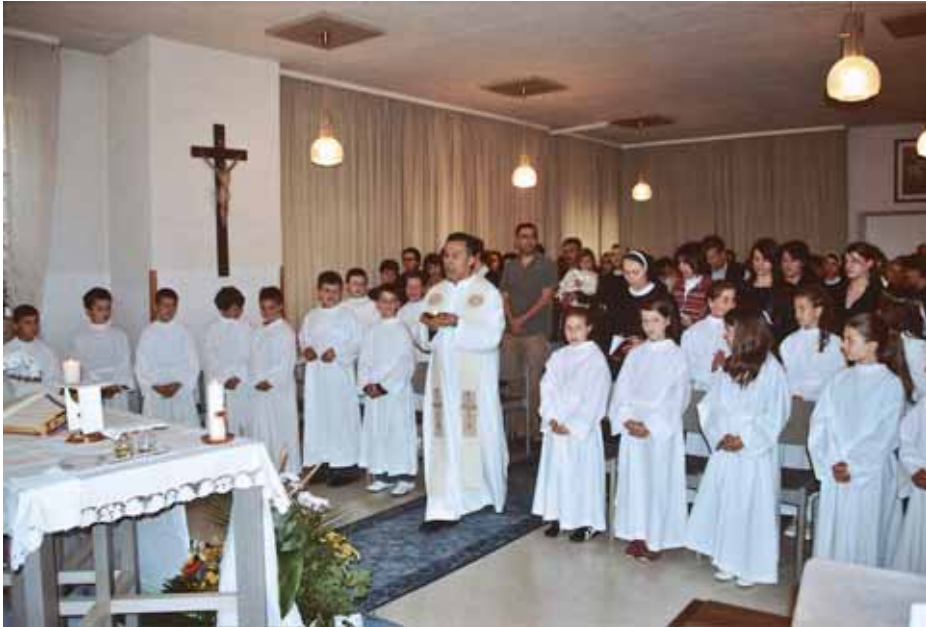
Zahvala za Prvu pričest u centru 8.05.2006

Za prvopričesnike je potrebno donijeti krsni list, ako prvopričesnik nije kršten u našoj misiji!