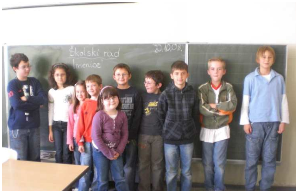
Hrvatski učenici u St. Georg Volskschule 2008/09

Od prošle se školske godine uvodi u Bavarsku hrvatska nastava konzularnog tipa i to u školama u Augsburgu, Dasingu, Freisingu, Ingolstadtu, Karlsfeldu, Nersingenu i Regensburgu, a ostvaruje se u suradnji s GK RH u Münchenu, Hrvatskim katoličkim misijama, njemačkim školama i kulturnim udrugama.