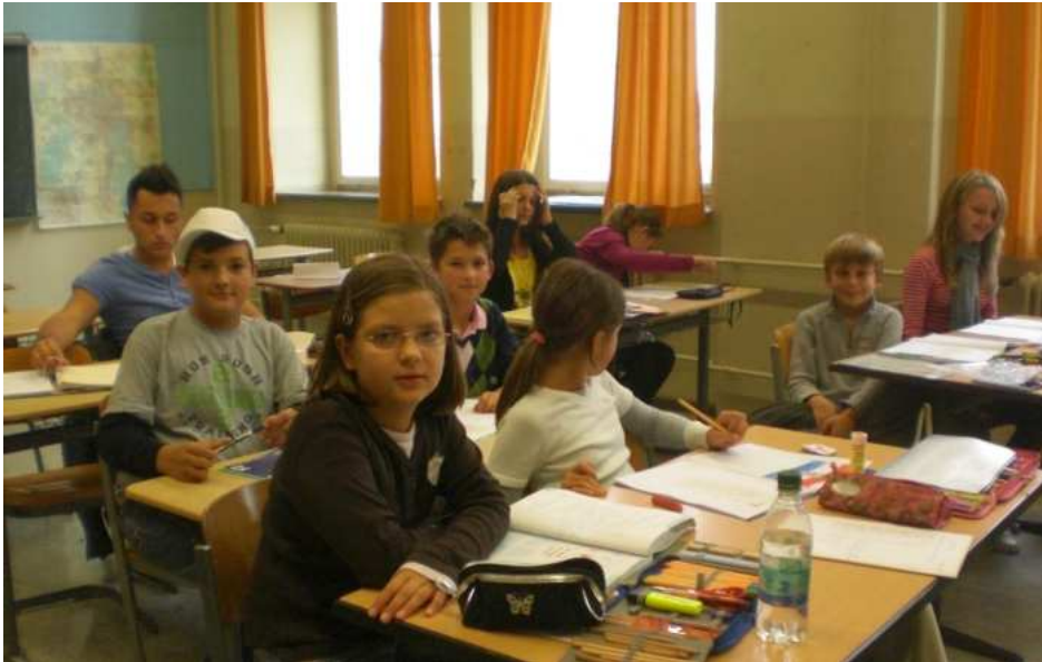
2.skupina učenika St. Georg VS 08/09