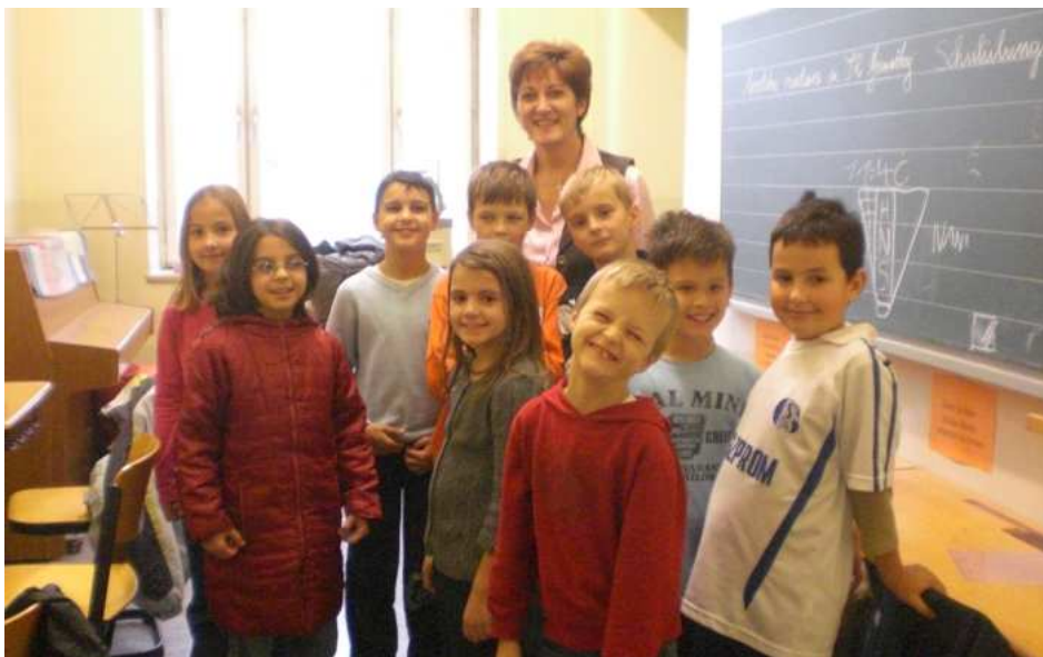
Učenici u Spichererschule 08/09

Trenutno se na području Augsburga i okolice nastava na hrvatskom jeziku održava u poslijepodnevним terminima od 14.00-15.30 sati i 15.30-17.00 sati u školama: