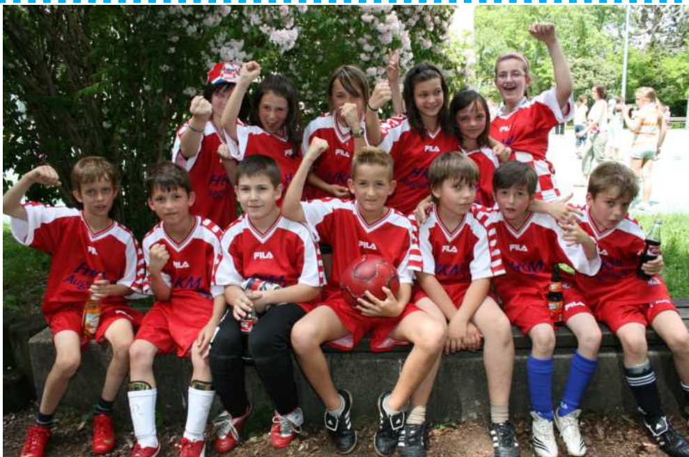
Ministranti su spremni za igru

„...koji jesi na nebesima“: Možda pomislimo kako ne treba Boga tražiti ovdje na zemlji i ne prepoznati ga u siromašnima i odbačenima?