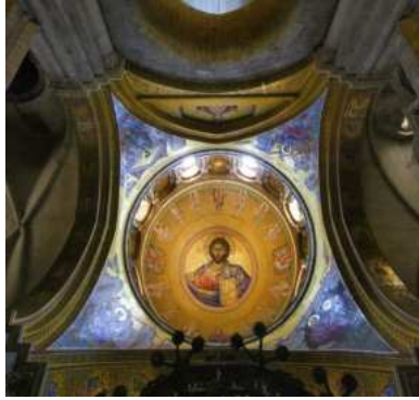
Isus Krist je središte svemira

Naši ljudi su željni duhovne hrane. Pokazala je to i ova duhovna obnova. Kroz dva dana sudjelovalo je na obnovi preko 3 tisuće osoba. Pretpostavljali smo da će zanimanje biti veliko. Zbog nedostatka pros-