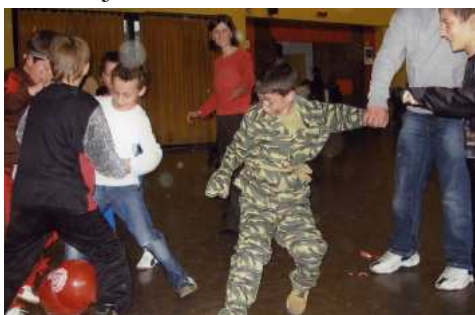
Jedni čuvaju balon a drugi ga love

pripremiti jer službeno radi u Dječjem vrtiću. Ima iskustva kako djecu u igri pokrenuti, a da budu zadovoljni. Igre bijahu raznovrsne i zanimljive. Djeca su ih rado prihvaćala. Puno smijeha bez plača. To je pravi uspjeh među mnoštvom djece. Nakon veselih igara