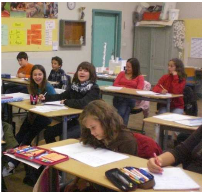
Augsburg Wittelsbacher VS utorkom 08/09

Hauptstr. 35, 86405 Meitingen, učionica br.1