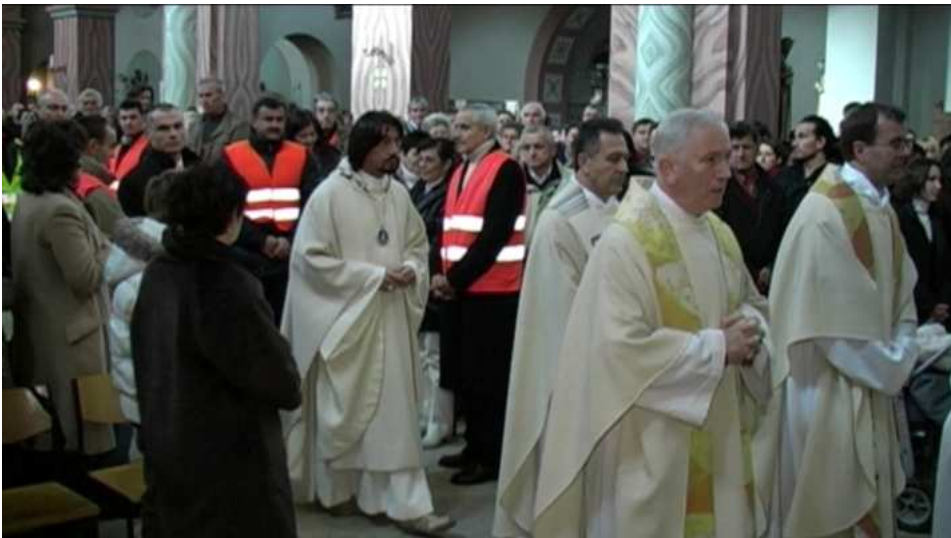
U crkvi je veliko mnoštvo otvorene duše

tora. Trideset ozbiljnih vjernika brinuli su se po crkvi i ispred crkve za red i pomoć. Dežurala je i medicinska služba maltesera po tri osobe, ako nekome dođe slabo Hvala Bogu, sve se odvijalo savršeno i bez nekih poteškoća.