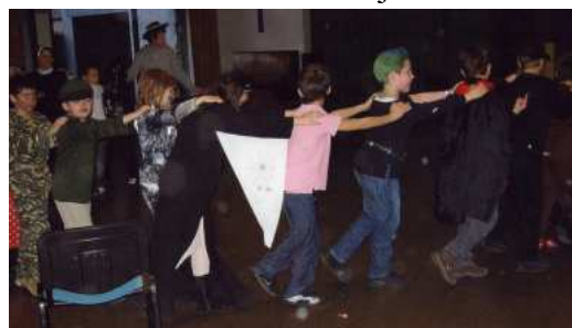
Svi su uključeni i zadovoljni

pozornici je pripremljena i glazba. Istina, ne uživo, ali tehnika je tu. Dugo je trebalo da dječaci pripreme svu tehniku, ali je uspjele. Bili smo sumnjičavi hoće li to uspjeti. Bojali smo se da mala djeca neće doći. Bilo je upitno je li im to zanimljivo da oni imaju svoju zabavu? Iznenađili smo se kad je u 15 sati na 01. veljače došao tako lijep broj djece različitih uzrasta: od 3. do 14. godina. Mnogi su roditelji dovezli malu djecu. Majke su veselo za stolom sjedile i razgovarale uz piće i krafne, a djeca su se igrala do iznemoglosti. Bijaše tu raznih igara u kojima su mogli svi sudjelovati. Gđa. Brzović to zna