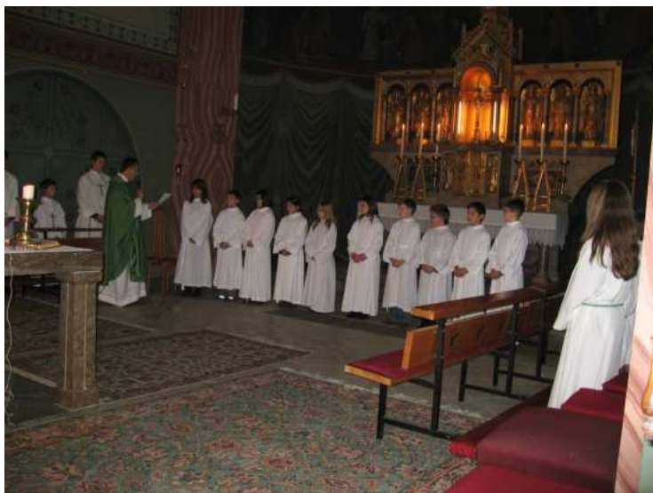
Primanje novih ministranata, listopad 2008

„Budi volja tvoja“: Tražimo li Božju volju u svom životu ili pokušavamo mi zapovijedati svemogućem Bogu i svoju sebičnu volju nametnuti Bogu?