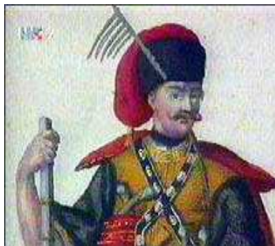
Nepobjedivi barun Trenk

„HŠDTrenk Augsburg“ dobilo je ime po Franji Trenku, hrvatskom barunu iz 18. stoljeća. Franjo Trenk rođen je 01.siječnja 1711.god. u Reggio di Calabria. Otac Ivan mu bijaše austrijski časnik Barun Franjo Trenk je živio na imanju nedaleko od Požege. Mjesto je po njemu kasnije nazvano Trenkovo. Vojnu školu je završio u Sopornu, te je već sa 16 godina bio zastavnik u puku Nikole Paffyja. Trenk dolazi veoma brzo na glas kao sjajan vojnik, ali i kao čovjek neobuzdane