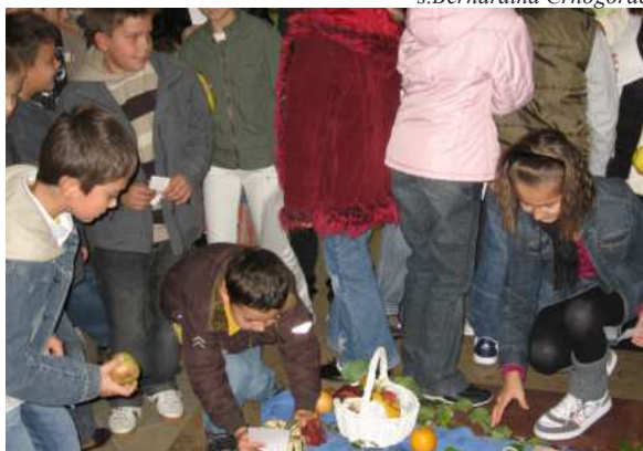
Djeca su prva u zahvalnosti i iskrenosti

Nezahvalnost zna biti veliki nedostatak kod nas ljudi jednih prema drugima. Zaboli nas kad doživimo da nam je netko bio nezahvalan kad smo učinili za njega: darovali mu svoje vrijeme ugled i novac, a on okreće glavu od nas. U duši se rodi razočaranje, a u ustima gorak osjećaj.